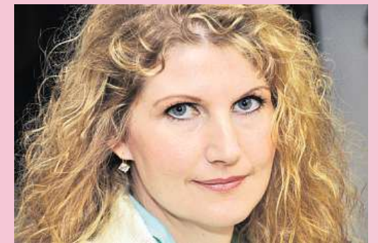
Natürlich werden die schönen Augen der Kandidatin unterstrichen und hervorgehoben.