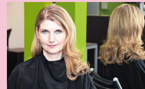
... geglättetes langes Haar, das lockig getragen werden kann ...