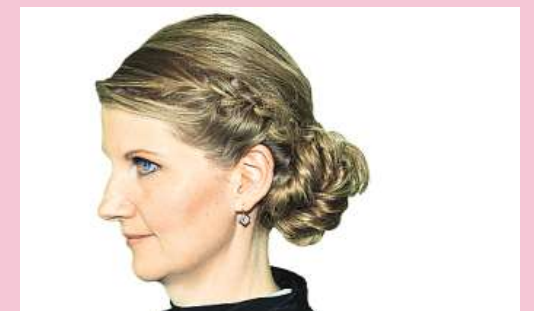
... oder eine moderne Frisur, mit eigenen geflochtenen Haaren, seitlich getragen.