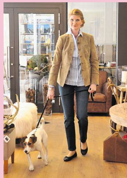
Eine vielfältige Palette von Sportlich-Elegant und Traditionell bietet Schöpf Living Landhausmode an.