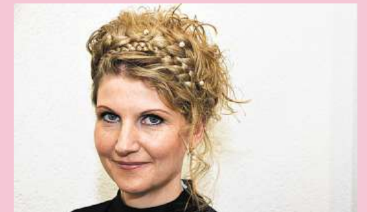
... Aufsteckfrisur mit künstlich eingeflochtenen Zöpfen ...